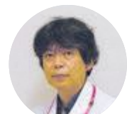
清水副院長 (整形外科医師)