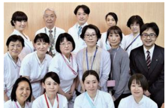
▲地域医療支援センター職員

患者さんやご家族一人ひとりの治療や生活に合わせたサポートを行っていますので、お困りの際は、気軽にお声かけください。