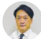
岩下内科担当診療部長 (脳神経内科医師)