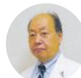
池田副院長 (放射線科医師)