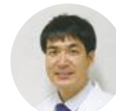
平岩外科担当診療部長 (消化器外科医師)